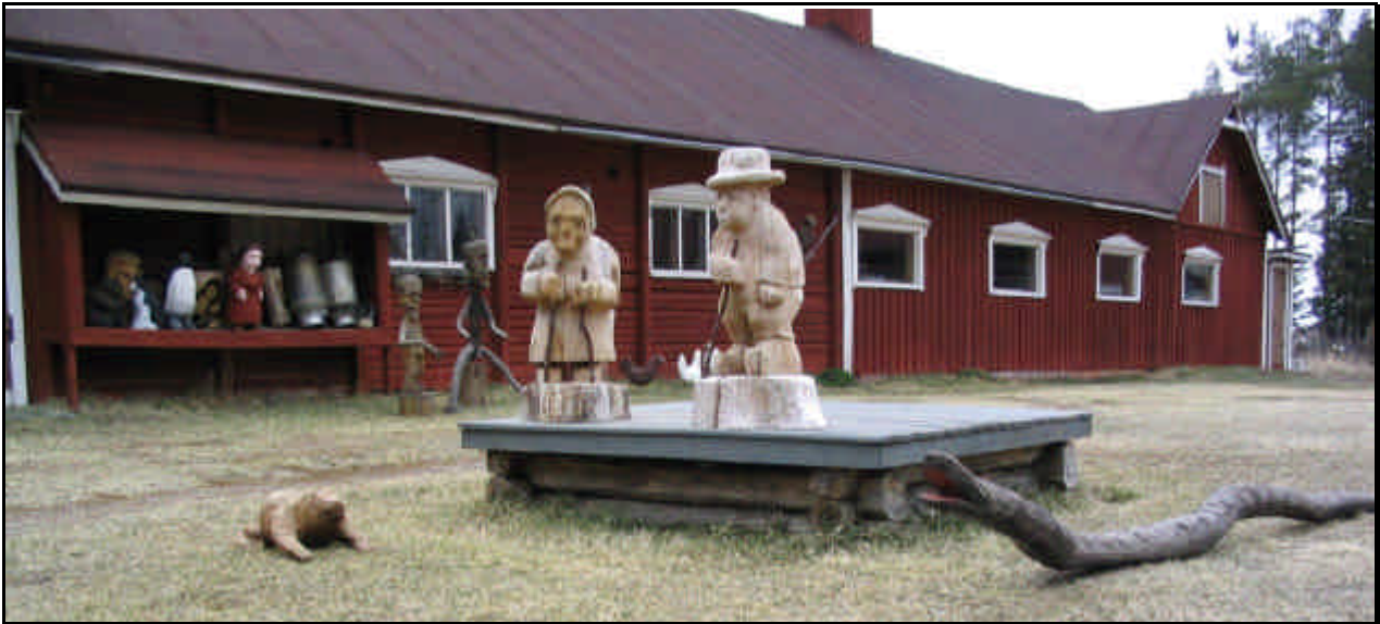
Pentti Sipolan pihapiiriä Ruukin Luohualla.