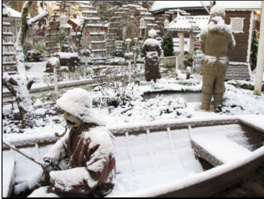
Eila Meriluodon piha Pietarsaassa.