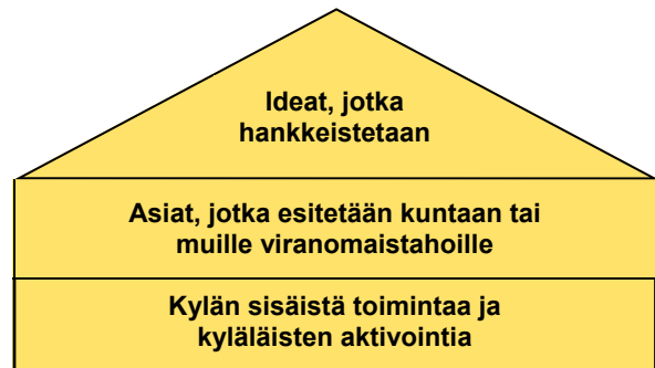
Kuva 2. Kyläsuunnitelmat sisältävät kuvassa esitetyt kolmen tasoiset tavoitteet.

Kylien tarpeet ja mahdollisuudet kartoitettiin ja kehitettiin niitä kylähankkeiksi asti – toimenpiteinä olivat kouluttaminen, neuvonta ja ohjaaminen.