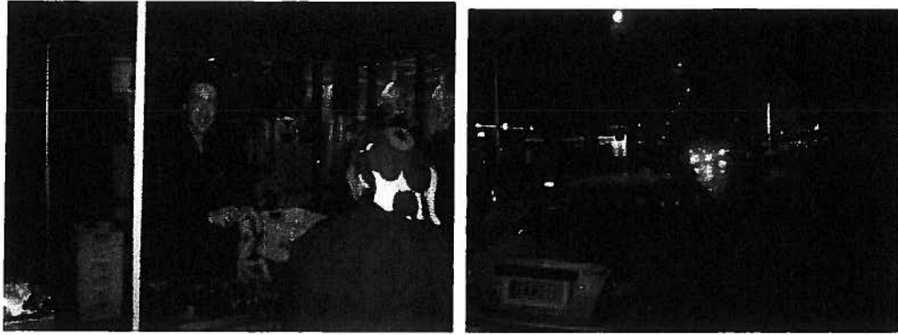
Kuvat Kauppojen Yö –tapahtumasta ja jokivalaistus teemasta.