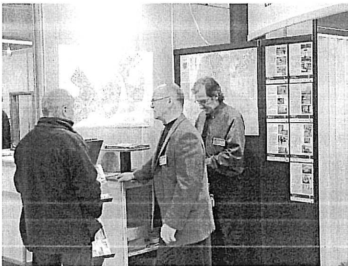
Kuva 4. Kyläesitteet olivat näyttävästi esillä kevään 2006 rakentajamessuilla Oulussa Yli-Iin kunnan osastolla. Hankkeen vetäjä oli esittelijänä Oulun rakentajamessuilla 2005.

Kylien markkinoinnin parantamiseksi pidettiin kotisivujen tekokoulutus, jossa tehtiin kylille kotisivuja. Kylillä ideoitiin kylän markkinointia ja sen tuloksena syntyi ensimmäinen kyläesite jokaiselle kahdeksalle Yli-Iin kylälle. Hankkeen vetäjä osallistui myös kunnan markkinointiin markkinoimalla kuntaa ja kyliä rakentajamessuilla sekä asuntomessuilla ja muissa tapahtumissa.