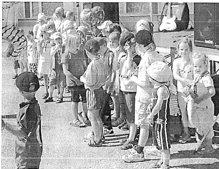
Kuva 5. Yli-Iin pitäjätapahtumilla lapset lauloivat omaksi ja muiden pitäjätapahtumavieraiden iloksi.

vetäjä oli mukana tukemassa työllään kylillä järjestettäviä tapahtumia. Hankkeen tukemia tapahtumia olivat Yli-Iin pitäjätapahtumat, onkikilpailut Tannilassa, Myllymarkkinat Haapakoskella, Venetsialaiset taajamassa ja uuden vuoden vastaanotto Yli-Iin torilla.