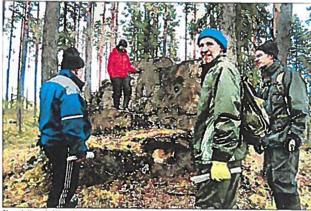
Alpuan kylä metsästä löytyy jyrkällä kiviseinällä.

! KUNNATKO YHTIESÖÖN , jonka tekemisistä, tarinoista ja ihmisistä olisi kerrottavaa muillakin? Tällä sivulla voisi olla sinun tekemäsi juttu porukastasi. Ota yhteyttä Kalevan yhteisötuottajaan yhteisot@kaleva.fi tai Erkki Hujaseen puh. 050 5900178 tai erkkihujajenen@kaleva.fi