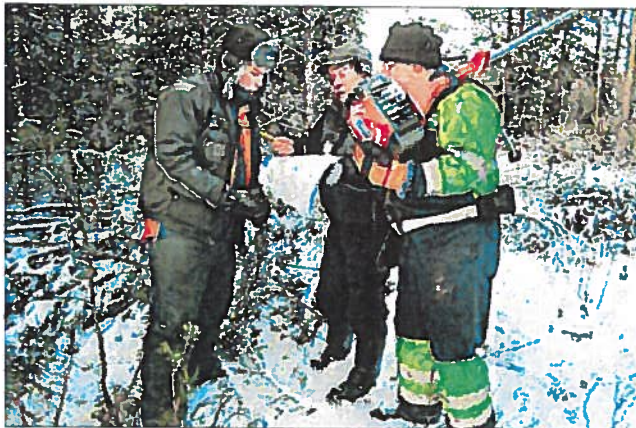
Piispan kodan paikkaa selvätään talvikaana.