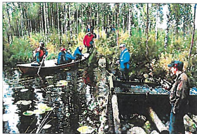
Kinttupolun talhoissa on välillä tarvittu venettäkin.