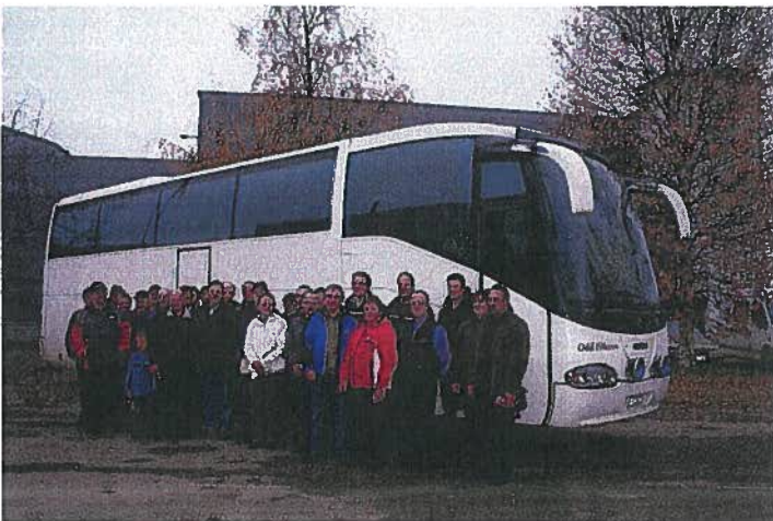
KoneAgria 2009 opintomatkalaiset Jyväskylässä