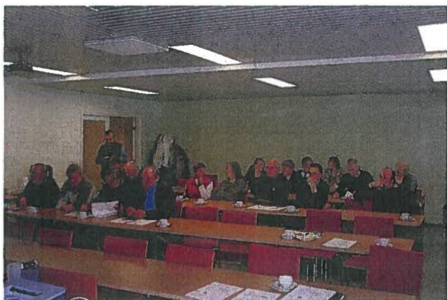
SPV- koulutus Kuusamo 6.11.2008