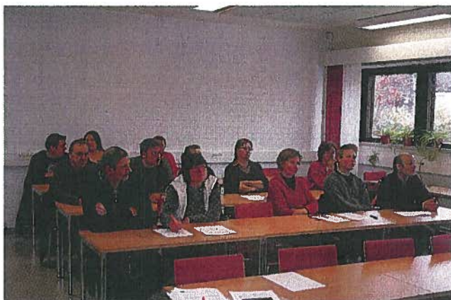
SPV -koulutus Kuusamo 6.10.2009