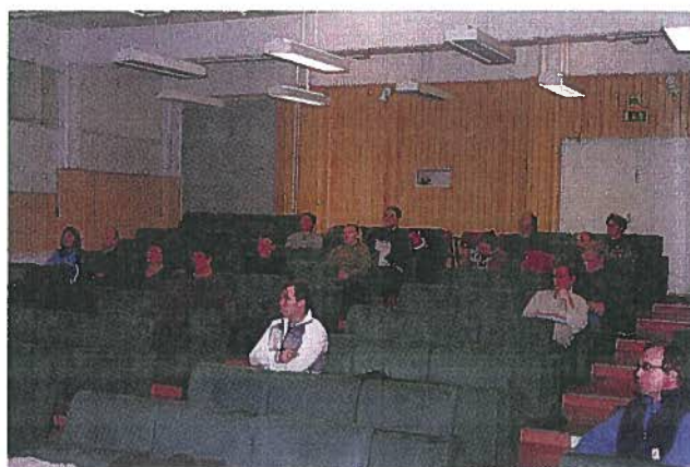
Maatilan johtamiskoulutus Posio 5.11.2008