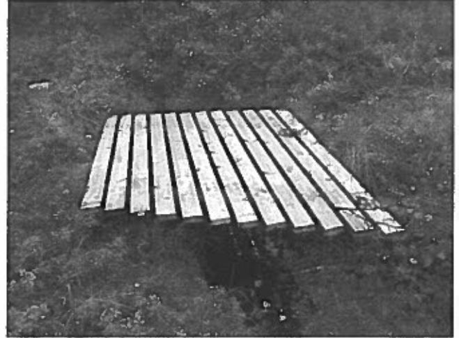
Kuvat 6 ja 7: Posion mökki- ja eräpalveluiden Mika Lahtela rakentamassa siltoja ja lavoja uudelle neljän kilometrin latureitille elokuussa 2014.