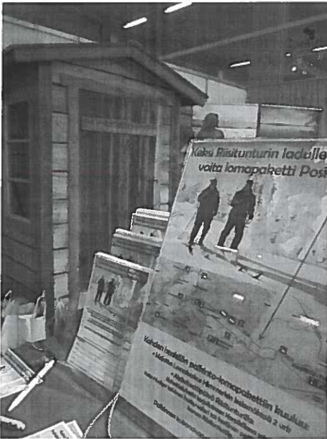
Kuva 8: Keksi Riisitunturin ladulle nimi! –kilpailu Posion osastolla Matka 2015 –messuilla.

Lisäksi hankkeen päätyttyä marraskuussa 2014 Riisitunturin latupoolin kanssa päätettiin järjestää uudelle ladulle nimikilpailu sekä virallinen avajais- ja nimenjulkistustapahtuma maaliskuulle 2013. Nimikilpailu oli isosti esillä myös Posion matkamessuosastolla vuoden 2015 alussa.