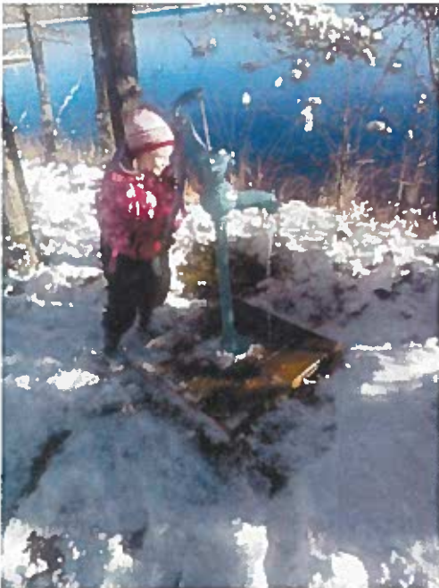
Kunnostettu kaivo Iso-Ahvenjärvi.