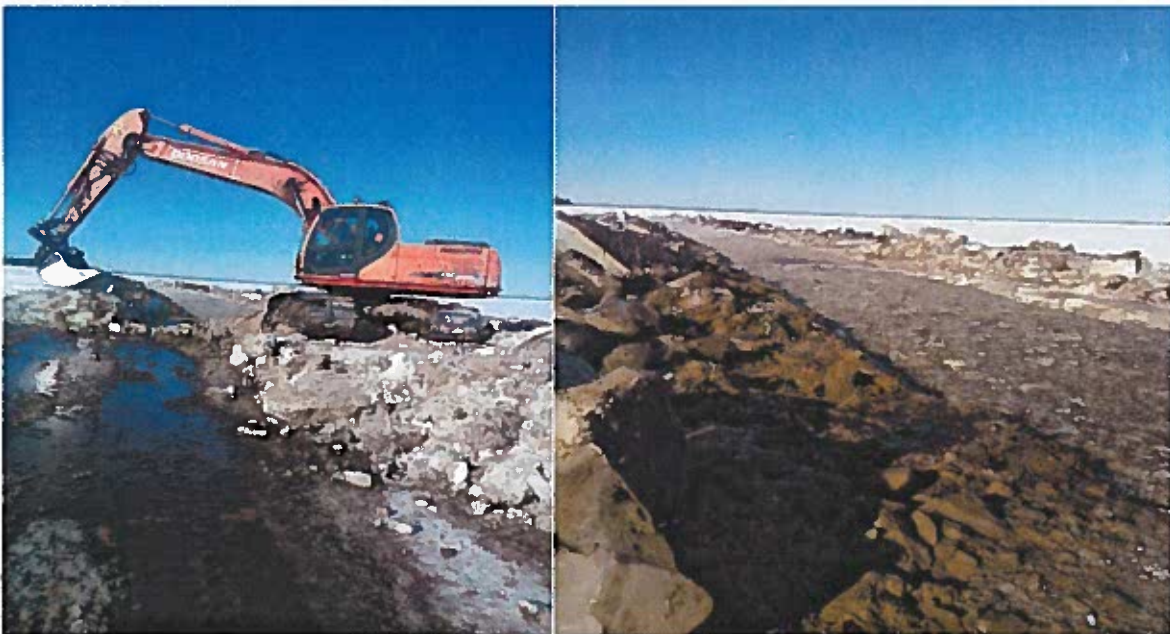
Venevylän ruoppauskuvia maaliskuulta 2013.

R-alue + radan valaistus linjauksen muutos jää pois.