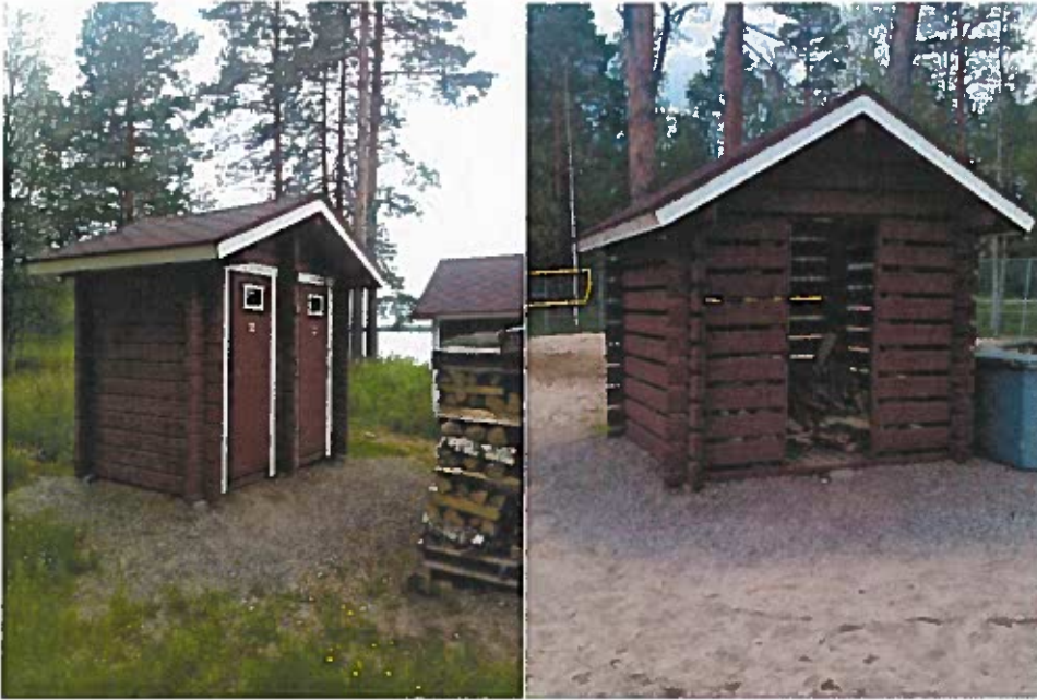
Museon uimarannan uusi wc ja puuliiteri.