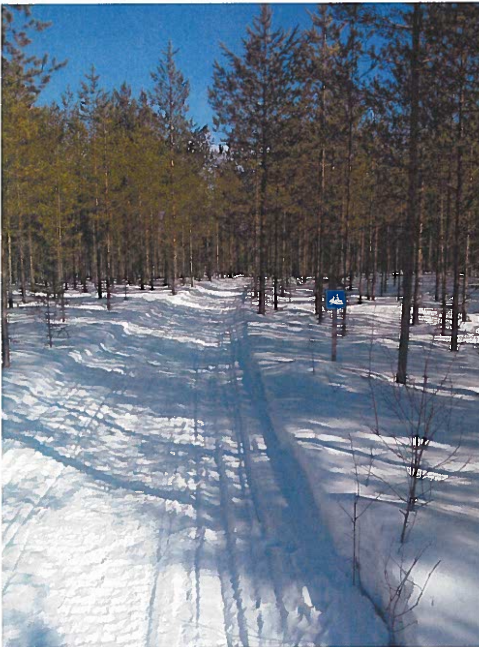
Moottorikelkkauraa Ukonojan maastossa.