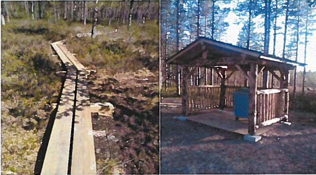
Uudet pitkospuut ja jätekatos Ahvenjärvellä.