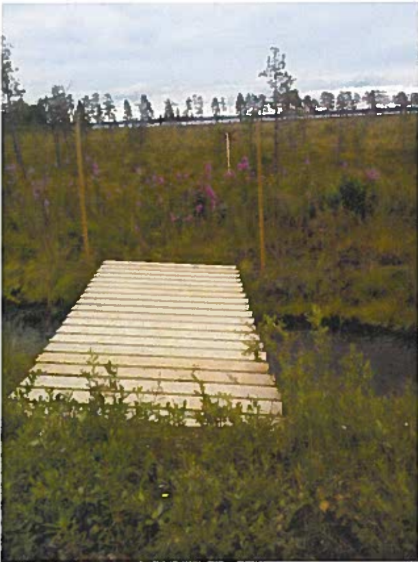
Kelkkauran silta Patasuolla Iso-lamujärvi-Pyhäjärvi reitillä.