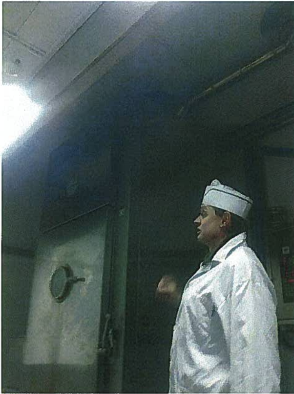
Kuusamon Kalatalon savu-uunin esittely käynnissä.

Hankesuunnittelua/ Sisävesikalastusmessut. Tutustumismatka Vihiluodon kalaan Kempeleessä ja Kuusamon kalataloon Kuusamossa. Samalla luotiin suhteita Pyhäjärvisen kalan markkinoille. Vihiluodon kala ostaisi Pyhäjärvistä kalaa, kunhan saataisiin logistiikka pelaamaan. Kartta-, logistiikka- ja koulutussuunnittelua.