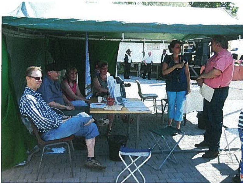
(Kuva1)Pyhäjärven Kehitys Oy:n "remmiä" Kihupäivillä henäkuulla.