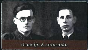
Armeija & sala-aika