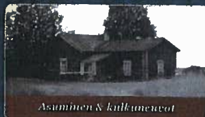
Asuminen & kulkuneuvot