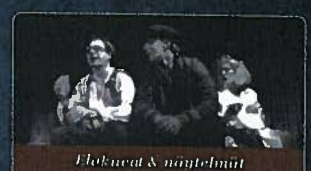
Hokuaat & näytelmät