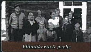
Elämäkerta & perhe