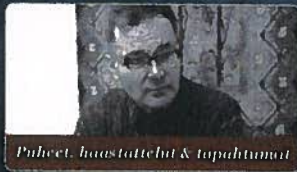
Puheet, haastattelut & tapahtumat