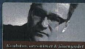
Koulutus, ura-aiheet & jäsenyydet