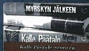
Kalle Päätalon -seura ry.