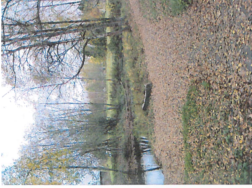
Pappilanniemen luontopolku kanootin laskuluiskan kohdalla

Polun rakentaminen kilpailutettiin ja polku rakennettiin hankesuunnitelman mukaisesti.