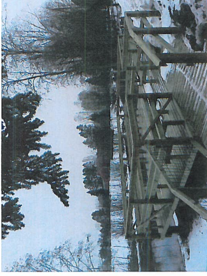
Alla Väinölän jokirannan laituri

Laituri kaiteineen ja siihen liittyvä polun osa rakennettiin. Rakentamistyö kilpailutettiin rahoituspäätöksen edellyttämällä tavalla.