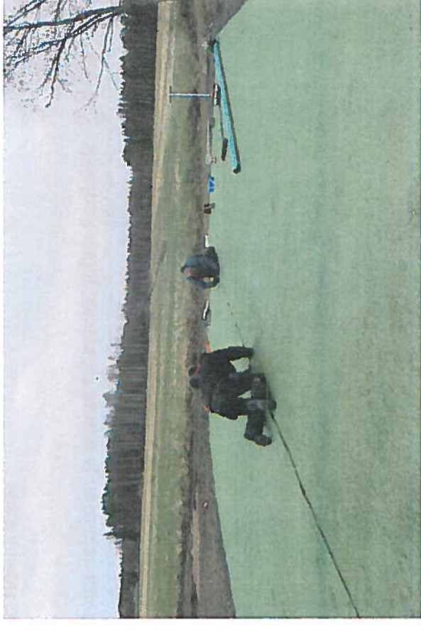
Harjoitusalueen keinonurmen asennustyöt

Rakennustyöt ja materiaalihankinnat kilpailutettiin rahoituspäätöksen mukaisesti.