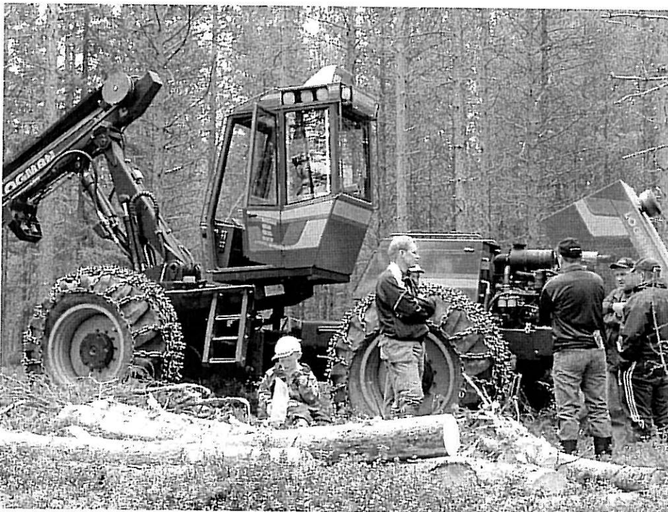
Kuva 3. Monet metsänomistajat ottivat Oulun konenäytökseen lapsensakin mukaan tutustumaan hakkuukoneisiin ja metsätyöhön. Metsuri opetti ja näytti tapahtumassa ensiharvennuksen tekoa. Kuva Janne Vimpari.

-Metsäpäivä Auran majalla Haukiputaalla 10.6.2005. Järjestäjinä Metsänhoitoyhdistys Oulun seutu, Haukipudas ja Muhos. Osallistujia 42 henkilöä. Tapahtumassa konenäytös ja metsäasiaa.