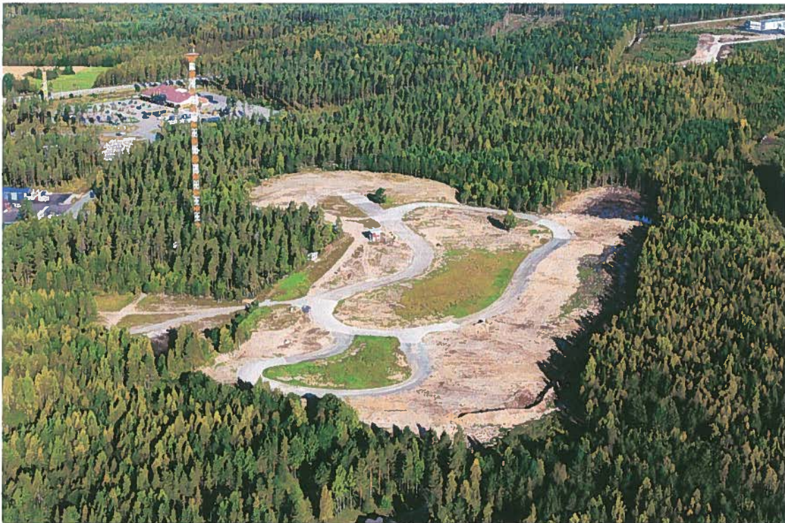
Mankola Circuit loppukesästä 2013.

Mankola – moottoriurheilukeskus nuorille –esiselvityshanke lähti halusta ja tarpeesta lähteä kehittämään lapsille ja nuorille uutta harrastuspaikkaa Pyhäjärvelle. Mankolan rata on ollut jokkis-harrastajien vähäisessä käytössä vuosikymmenien ajan. Paikan sijainti ja saavutettavuus on erinomainen, niin paikkakuntalaisille kuin lähialueelta ja kauempaakin. Harrastusalueen tukena vieressä on mahdollisuudet ruokailuun sekä harrastusvälineiden huoltoon ja korjaukseen. Nelostien ja valtatie 27:n risteysalueella sijainti tukee myös alueen muuta kehittämistä (liikennevirta, teollisuus ja palvelutoiminnot).