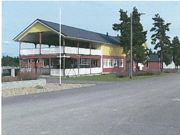
Pesämäen moottoriurheilukeskuksen Motohaussi

Hyvä rakennus toimii kahvio- ja huoltorakennuksena, josta löytyy myös wc- ja suihkutilat ja toimisto. Kahviotila toimisi myös koulutuspaikkana. Rakennusta voisi myös vuokrata kulujen kattamiseksi ulkopuoliseen koulutus- ja kokouskäyttöön. Peuratalojen mukana ollessa rakennus voisi toimia myös heidän mallirakennuksena.