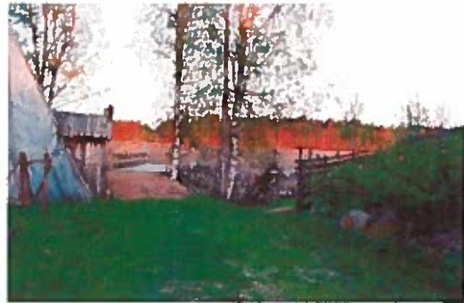
Silta Kärsämäenjoen yli Sykkeen kohdalla

Alkuperäinen aikomus Kärsämäenjoen sulaaikaista ylitystä varten ollut (porraspuurakenne) muutettiin kevyen liikkumisen mahdollistavaksi sillaksi. Perusteena se, että talviaikanakin jokeen voi tulla vettä, joka estää kelkalla joen ylittämisen ja toisaalta maastopyörien kuljettaminen on sillan kannella helpompaa. Esimerkkinä on etapista tehty maastotöiden kustannusbudjetti sekä sen lopullinen toteutuma