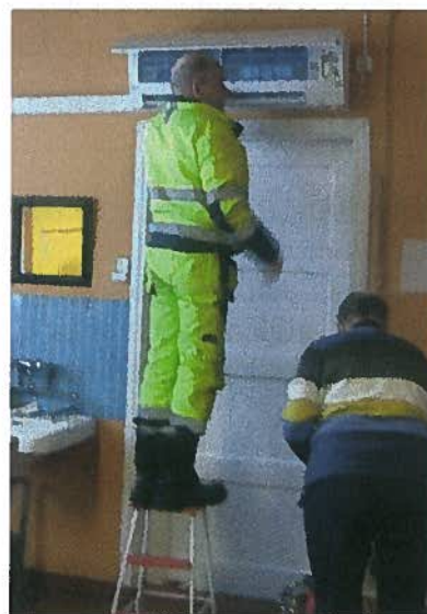
Kuvat ilmalämpöpumpun käyttöpastustilaisuudesta Vuohotmäeltä.