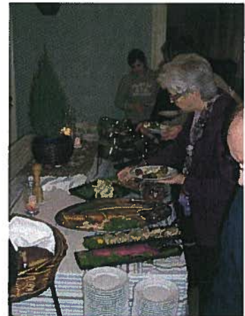
... kuin myös Vuojoen kartanossa