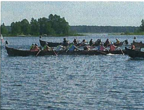
HiijenSoudussa joko kilpaillaan hiki lätsässä tai nautitaan järvimaisemasta retkisarjassa