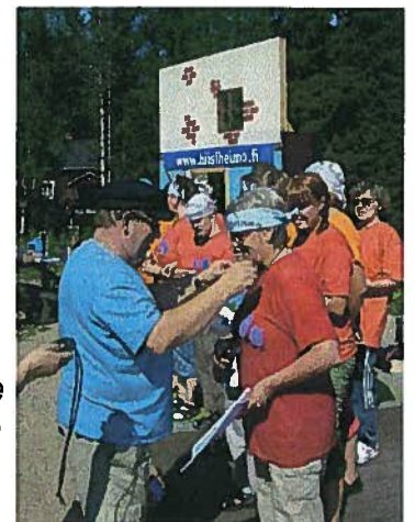
Kaislarannan joukkue osallistujamitalien vastaanottovuorossa