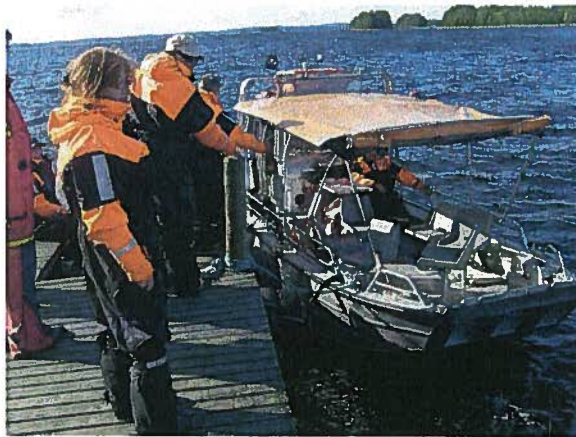
JP-Kalamatkojen kalusto valmiina