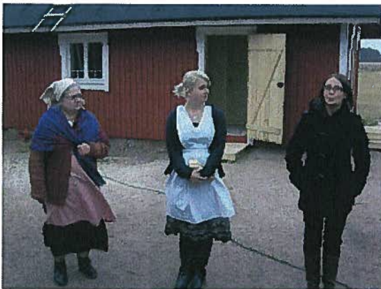
Satakunnan reissulla kävimme niin Välimaan Perinnetorpalla