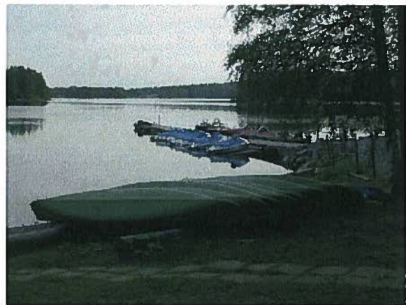
... samoin SeikkailuKuopio Oy:n