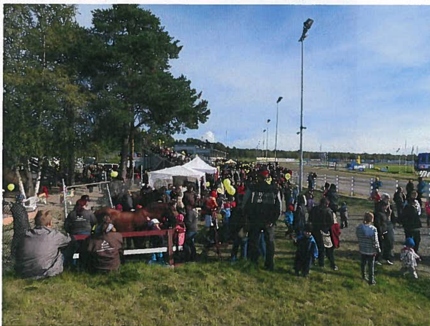
Oulun Ravien ja sanomalehti Kalevan kanssa yhteistyössä syyskuussa 2012 järjestetty Ookko nää hevostellu tapahtuma veti Äimärautiolle noin 1200 hengen ennätysyleisön – avoimille hevosalan esittelytapahtumille näyttäisi olevan kysyntää!