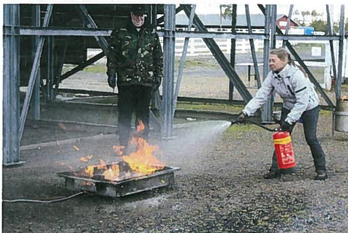
Paloturvallisuus –päivässä harjoiteltiin sekä sammuttimen että sammutuspeitteen käyttöä.

15.9.2012 järjestettiin Äimärautiolla Oulussa yhteistyössä Oulun Läänin Hevosenomistajain yhdistyksen ja Suomen Pelastusalan Keskusjärjestön kanssa Tallien paloturvallisuus –päivä, johon osallistui 19 henkilöä. Luennolla käytiin laajalti läpi tallien paloturvallisuuteen liittyviä seikkoja ja käytännössä harjoiteltiin alkusammutusta. Tilaisuudessa saadut tiedot ja taidot oikeuttavat osallistujat AS1-alkusammutuskortin lunastamiseen.