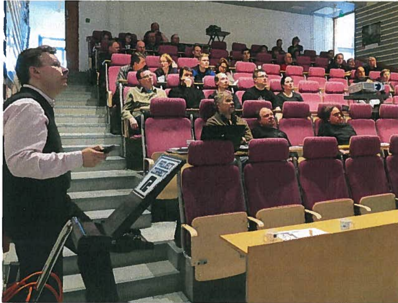
Hevosheinän viljelijät seurasivat Muhoksen Koivikon auditoriossa mielenkiinnolla laatuheinän tuotannon käytännön oppeja.