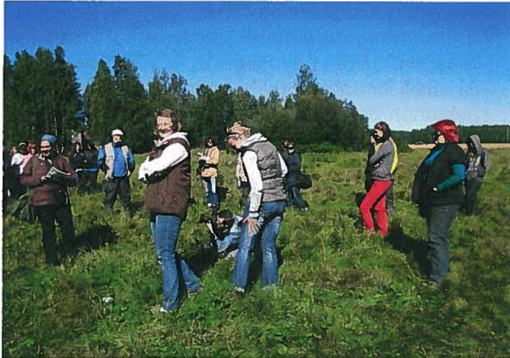
Rannan tilalla tutustuttiin paikan päällä tilan luonnonlaitumeen, jota hevoset ovat hoitaneet jo useamman vuoden ajan.