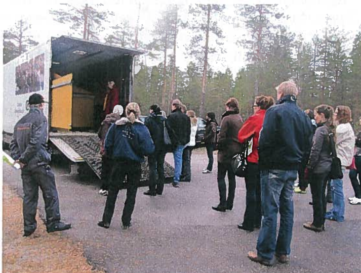
Ammattimaisesti hevosia kuljettava Autokuljetus Sipola esitteli kuljetuskalustoaan infopäivissä.