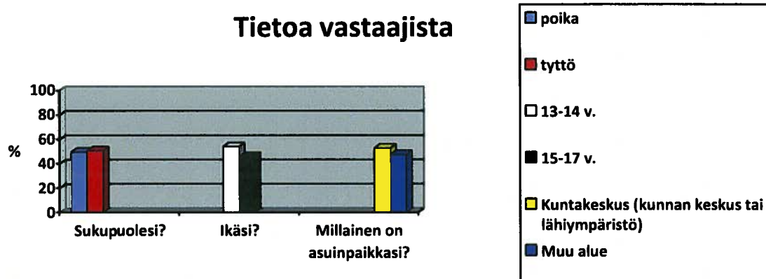
taulukko 1. Perustiedot vastaajista jakoutuivat tasaisesti kyselyssä annetuille vaihtoehdoille.

Asuinpaikaa kysyttäessä 52,7% ilmoitti asuvansa kuntakeskuksessa (kunnan keskusta tai lähiympäristö.) 47,3% ilmoitti asuinpaikakseen muu alue . Kuntien yhdistymiset aiheuttivat jonkin verran mietintää nuorissa. Käsite kuntakeskus ei ollut saadun palautteen mukaan läheskään selvä. Esim. nykyisen Siikalatvan kunnan alueella oli epäselvää missä on uuden kunnan keskus. Kysymyksessä tavoiteltiin kuitenkin alueen toimintojen keskusta eli taajamaa eikä niinkään virallista kunnan keskustaa. Tämä saattaa jonkin verran vääristää tulosta.