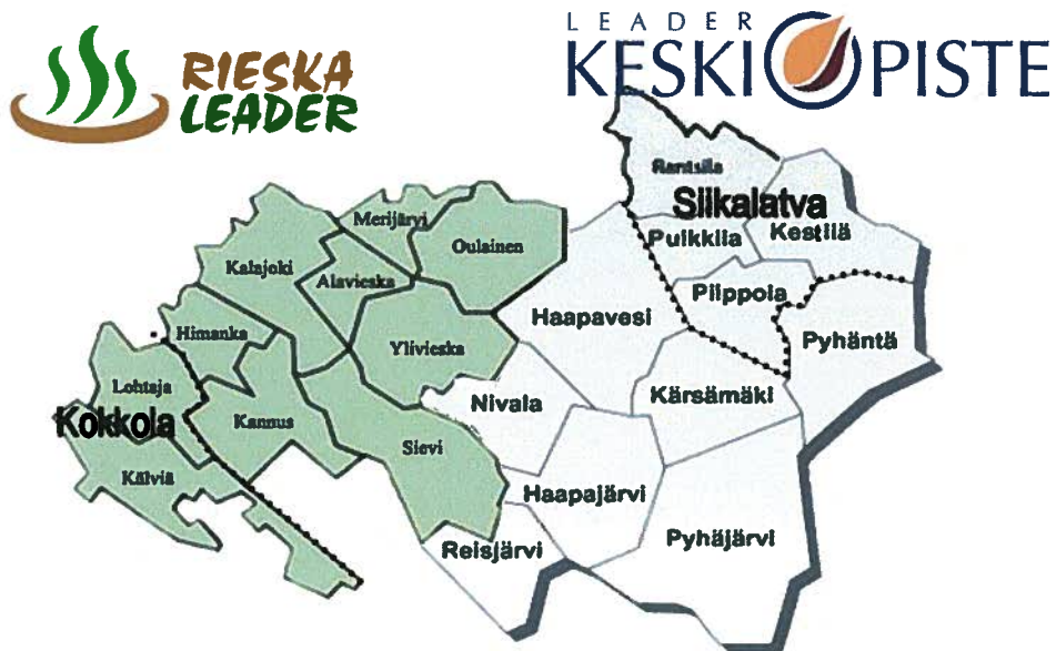
kuva 1. Hankealue koostuu Rieska- ja Keskipiste -leaderin alueista.

Hankkeen hyötyjinä ovat Rieska- ja Keskipiste -leaderin alueen 13-17 vuotiaat nuoret sekä alueella toimivat nuorisotyöntekijät. Alueella on kuntien yhdistymisten vuoksi 16 kuntaa. Vanhan kuntajaon mukaan kuntia on 21. Uusi Siikalatavan kunta käsittää Pulkkilan, Kestilän, Piippolan ja Rantsilan alueet. Alueen toiselta laidalta Kälviän ja Lohtajan alueet ovat liittyneet Kokkolaan. Yhdistyneiden kuntien alueilla nuorisotyötä tehdään yhteistyössä, mutta alueelliset toimintatavat ovat erilaiset, joten tässä hankkeessa on käsitelty kuntia osittain vielä vanhan kuntajaon mukaan.