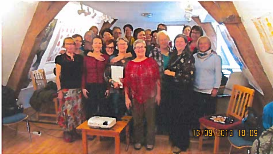
Ryhmäkuva Likamundin Heilraktierschuleen Füssenissä, Saksa 2013

Yhteistyössä alueen yrittäjien kanssa suunnitelimme opintomatkat. Yrittäjät ovat kiinnostuneet niin kotimaan kuin ulkomaankin yhteistyöstä koululääketieteen ja luontaishoitoalan sekä julkisen terveyden hoitoalan toimijoiden kesken. Erityisesti Keski-Euroopassa luontaishoitoalalla on pidemmät perinteet toimia hyvinvointi- ja terapia-alalla. Yrittäjät ovat kiinnostuneet tekemään yhteistyötä hyvinvointialan yrittäjien kanssa, jossa koululääketiede ja vaihtoehtohoidot toimivat jo rintarinnan. Tutustumiskohteina olivat sellaiset paikat, jossa yhdistyi majoitus-, koulutus- ja hyvinvointipalvelut.