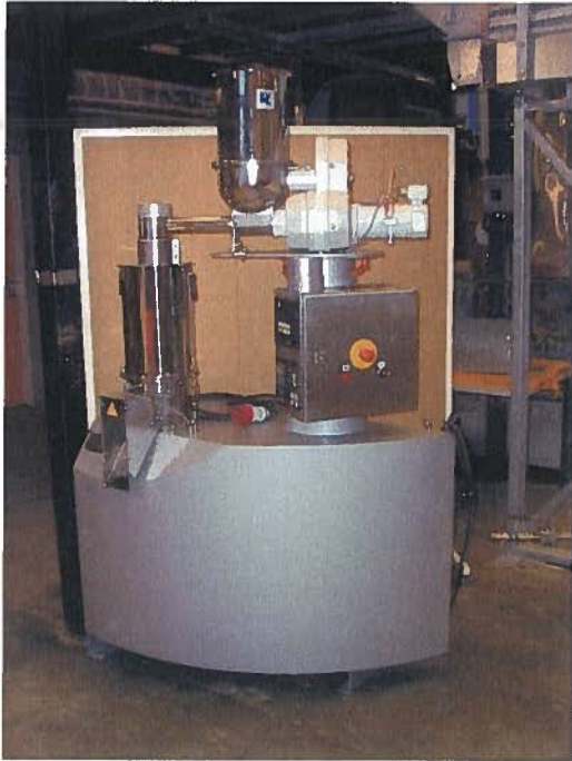
Kuva 4. Oulun yliopiston Amandus Kahl tasomatriisipuristin