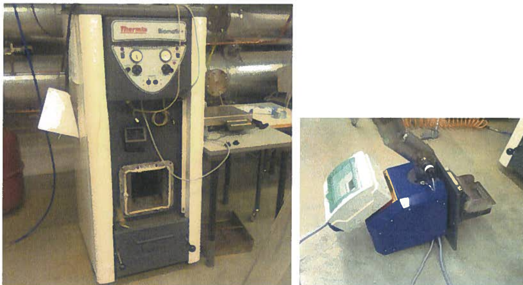
Kuva 2. Oamk:n Tekniikan yksikön pienkattila (20 kW) ja kuppimallinen pellettipoltin.

http://www.oamk.fi/hankkeet/ekopelletti/docs/EkoPelletti_Pelletointi-%20ja%20polttokokeet_raportti.pdf .