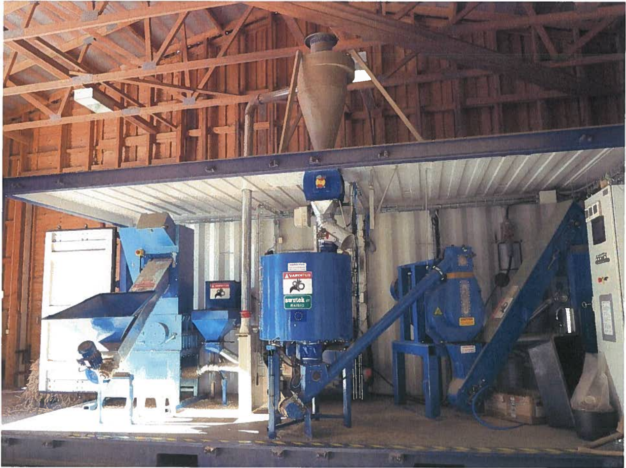
Kuva 1. Oamk:n Luonnonvara-alan yksikön liikuteltava, pilot-mittakaavan pelletöintilaitteisto.

Pelletöintikokeista on tehty raportti, joka on luettavissa hankkeen nettisivuilla osoitteessa http://www.oamk.fi/hankkeet/ekopelletti/docs/EkoPelletti_Pelletointi-%20ja%20polttokokeet_raportti.pdf . Pelletöintikokeiden tuloksista on kirjoitettu myös artikkeli Bioenergia –lehden numeroon 5/2012.