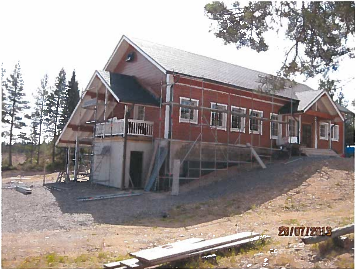
AAKON MAJA JA VIHKIÄISTEN LAITTOA