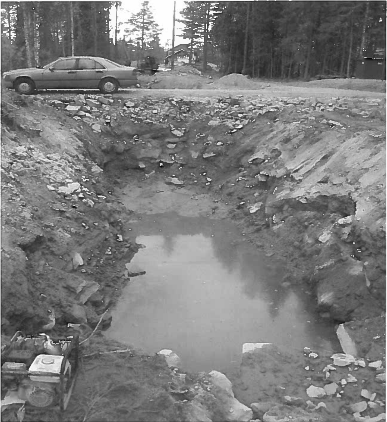
TIENALITUS, MAJA NÄKYVÄ TAKANA