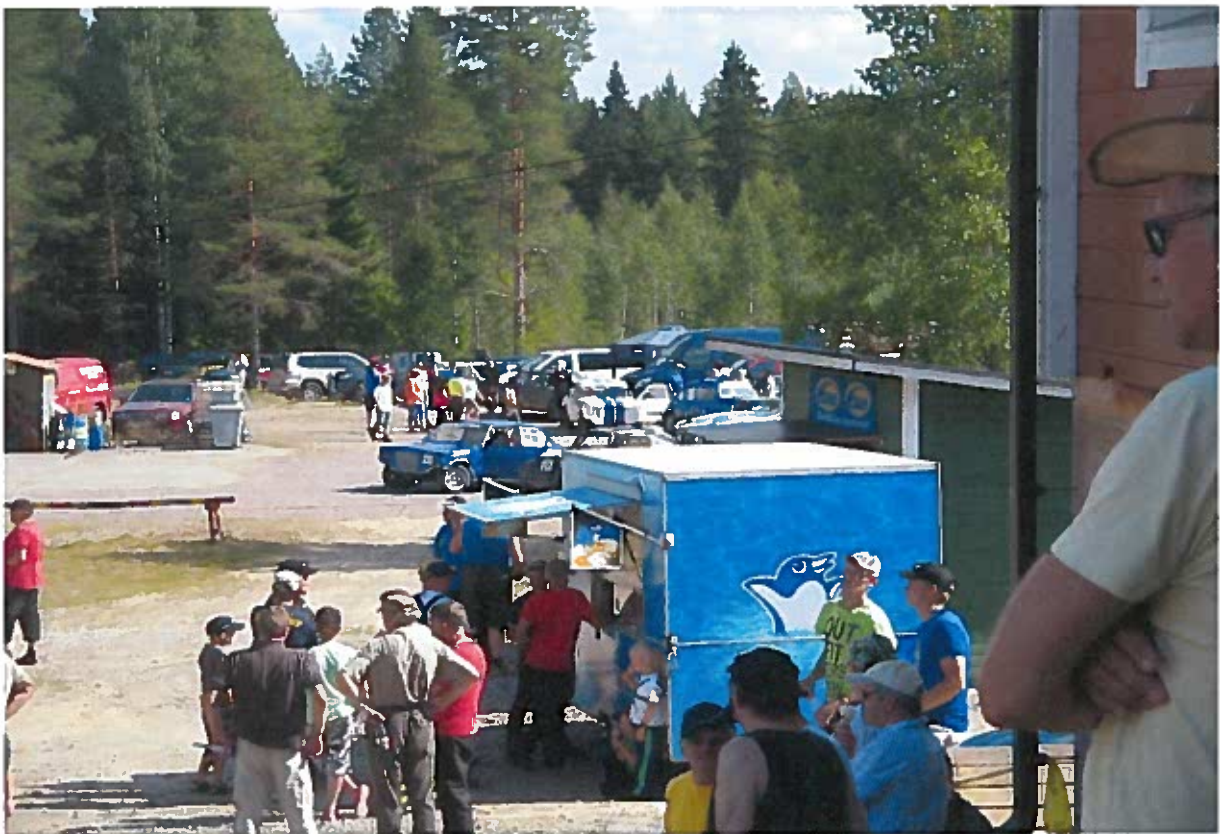
JOKKISKISAT KESÄLLÄ 2013