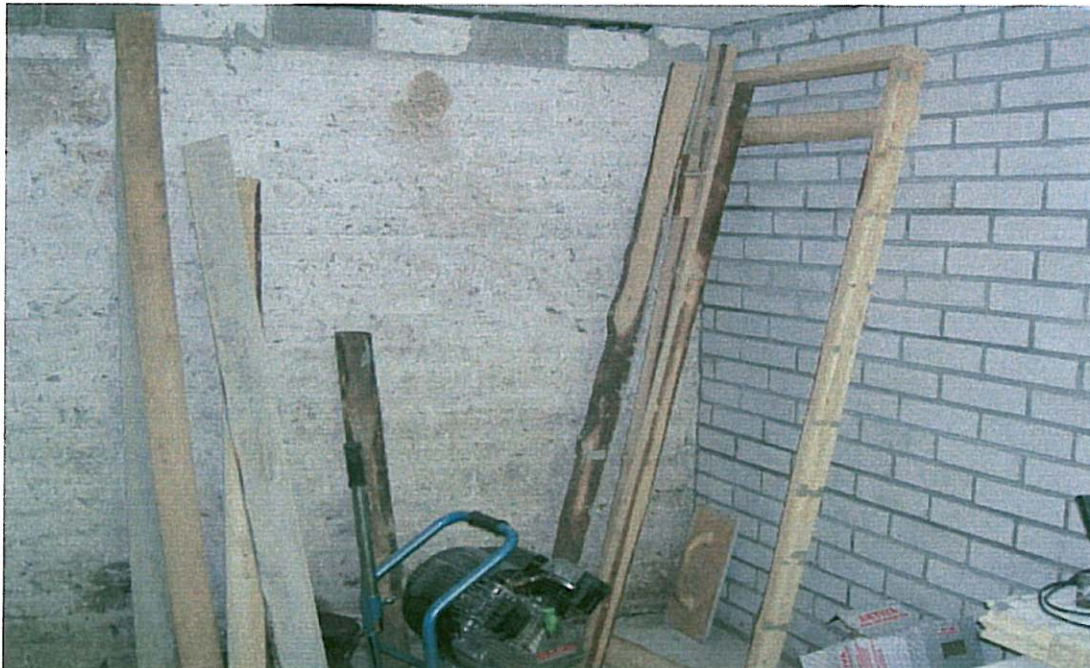
Saunatilat ennen remonttia...

Remontti aloitettiin kellarikerroksesta, entisestä halkovarastosta piikattiin vanha betonilattia pois ja poistettiin täytemaata n. 20 cm, jotta huonekorkeutta saatiin lisää. Tähän rakennettiin uudet sauna- ja pesutilat, wc, pukuhuone, oleskelutila sekä pyykinpesu- ja kuivaustilat.