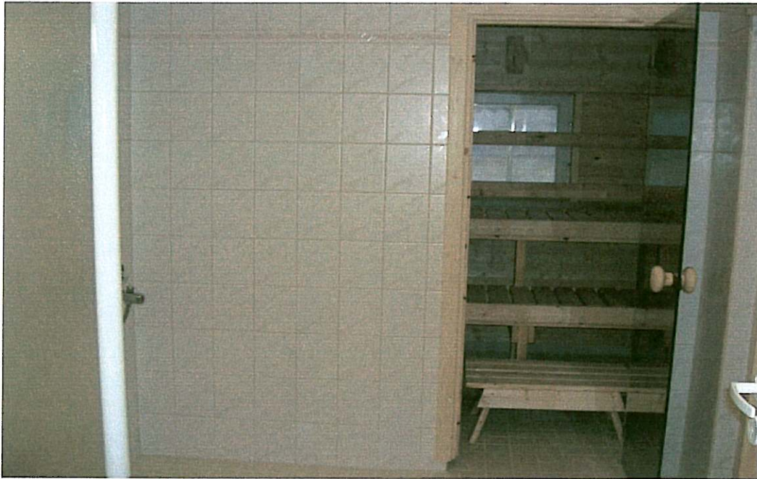
... ja remontin jälkeen

Remontti jatkui talon ”yläkerrassa”, sinne tehtiin entisen suihkutilan tilalle inva-wc ja ulko-ovelle tehtiin inva-luiska helpottamaan liikuntaesteisten taloon pääsyä.